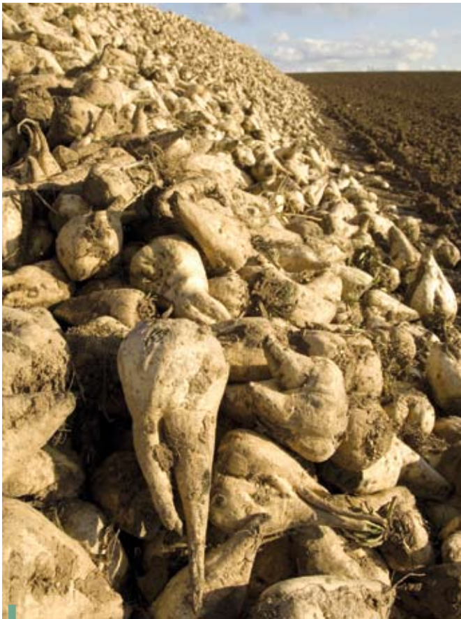
La mélasse de betterave, résidu de la cristallisation et du raffinage du sucre, peut servir à la production de bioéthanol.